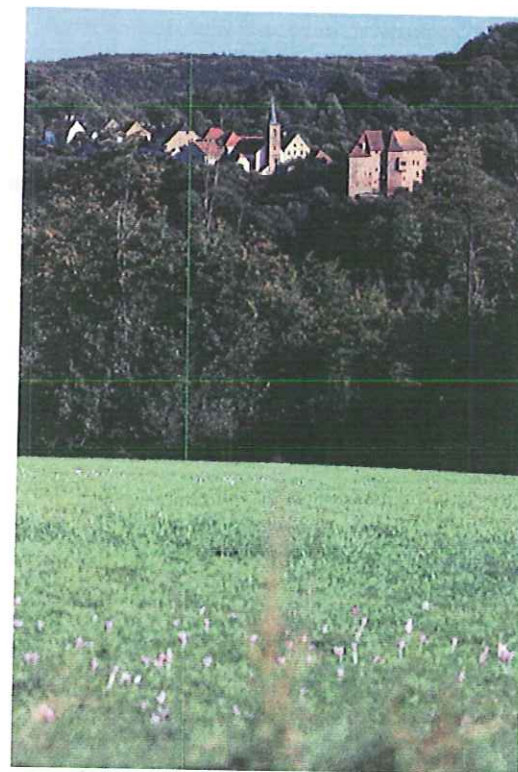
Le Staedtel et le château de La Petite-Pierre